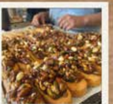
Bartelette fruits secs